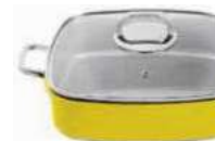
Roasting pan with lid

Casseruola carré con coperchio Bräter mit Deckel Rôtissoire avec couvercle Asadera con tapa