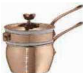
Bain-marie with porcelain Bagnomaria con porcellana Wasserbadkasserolle mit Porzellan Bain-marie avec porcelaine Baño maría con porcelana