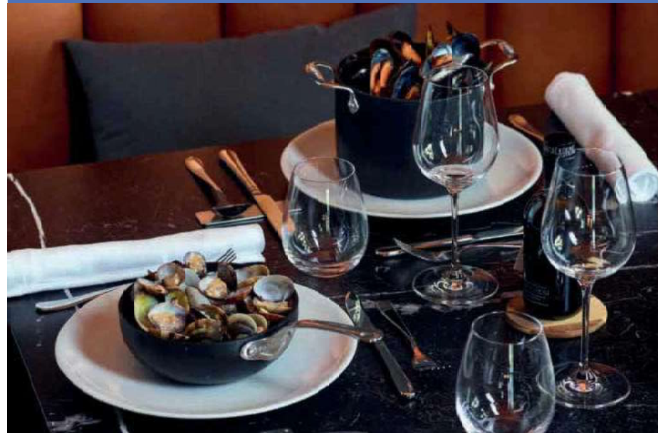
Ideal for serving from stovetop to table. Aluminum 99,5%. Thickness 3 mm. HP Dylon internal and external non-stick coating. Handle and rivets in stainless steel. Although the product can be washed in the dishwasher, we recommend hand washing to ensure beauty and performance over time.