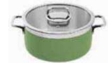
Stew pan with lid

Casseruola con coperchio Bratopf mit Deckel Sautoir avec couvercle Sartén con tapa