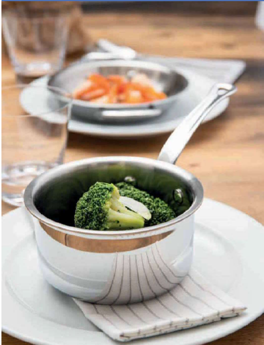
Paderno Serie 12200 3-ply, inside stainless steel satin polished, intermediate layer in aluminum, outside stainless steel mirror polished. Thickness 2 mm. Stainless steel cast handles, stainless steel rivets. Suitable for use on any heating element.