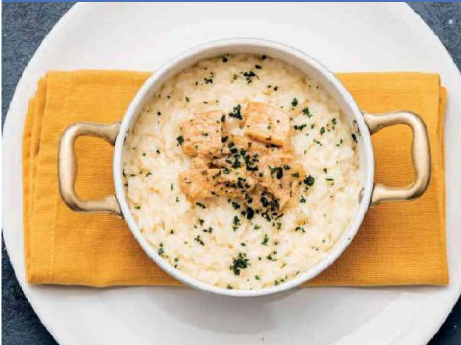
Aluminum body non-stick coated, brass handles. To add a touch of originality to any dish.