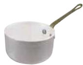
Saucepan Casseruola alta Stielkasserole, hoch Casserole haute Cazo recto alto