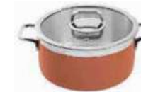
Stew pan with lid

Casseruola con coperchio Bratopf mit Deckel Sautoir avec couvercle Sartén con tapa