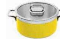
Stew pan with lid

Casseruola con coperchio Bratopf mit Deckel Sautoir avec couvercle Sartén con tapa