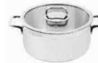
Stew pan with lid

Casseruola con coperchio Bratopf mit Deckel Sautoir avec couvercle Sartén con tapa