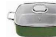
Roasting pan with lid

Casseruola carré con coperchio Bräter mit Deckel Rôtissoire avec couvercle Asadera con tapa