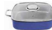
Roasting pan with lid

Casseruola carré con coperchio Bräter mit Deckel Rôtissoire avec couvercle Asadera con tapa