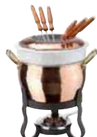
Fondue set with porcelain Set fonduta con porcellana Fondue-Service mit Porzellan Service à fondue avec porcelaine Servicio fondue con porcelana