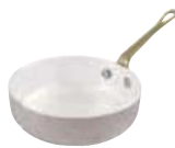
Frypan Padella Bratpfanne Poêle à frir Sarten