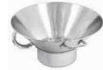
Fry dripping tray Colafritto Pommes-Frites-Seiher Egouttoir à friture