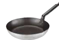
Frypan, non stick, cast iron handle Padella antiaderente, manico ferro Bratpfanne, nichttaffend, Gusseisen-Stiel Poêle, anti-adhérente, queue fonte Sartén antiaderente, mango hierro