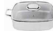
Roasting pan with lid

Casseruola carré con coperchio Bräter mit Deckel Rôtissoire avec couvercle Asadera con tapa