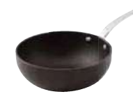
Wok pan Wok Wok-Pfanne Poêle chinoise Wok