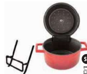
Lid holder set 2 pieces Set 2 reggi coperchio 2er-Set Deckelhalter 2 support à couvercle Juego de 2 soporte para tapa