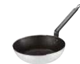
Frypan, non stick, cast iron handle Padella bombata antiaderente, manico ferro Bratpfanne, nichttaffend, Gusseisen-Stiel Poêle bombé, anti-adhérente, queue fonte Sartén antiaderente, mango hierro