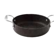
Low sauce pot Casseruola bassa Flache Kasserolle Faitout bas Cacerola baja