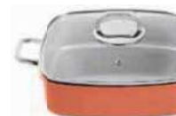
Roasting pan with lid

Casseruola carré con coperchio Bräter mit Deckel Rôtissoire avec couvercle Asadera con tapa