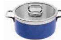
Stew pan with lid

Casseruola con coperchio Bratopf mit Deckel Sautoir avec couvercle Sartén con tapa