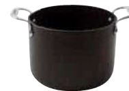
Mussel pot Cocotte per molluschi Muscheltopf Casserole coquillage Cacerola para mejillones