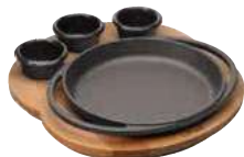
Round pan with wooden board Padella tonda con tagliere legno Runde Pfanne mit Holzbrett Poêle ronde avec planche en bois Sartén redonda con tabla de madera